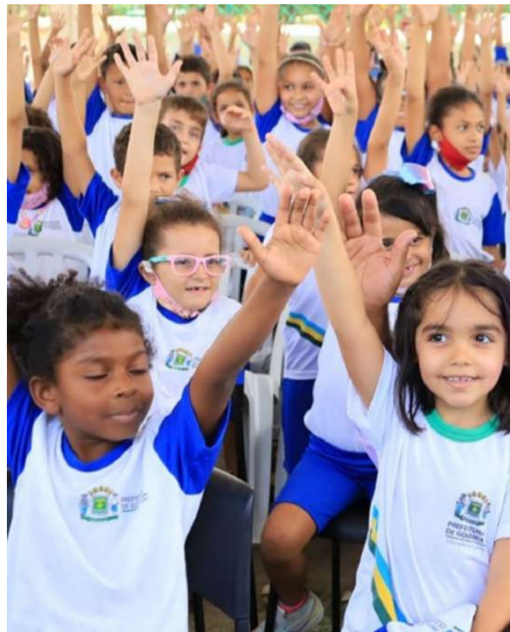
Compromisso Nacional Criança Alfabetizada busca garantir que 100% das crianças do 2º ano do ensino fundamental saibam ler e escrever

Para 2024, a meta de alfabetização almejada pelo governo é de 60% das crianças brasileiras. Esse percentual sobe para 64% em 2025 e 67%, em 2026. Nos anos seguintes, as metas sobem para 71% (em 2027); 74% (2028), 77% (2029), até superar os 80% a partir de 2030.