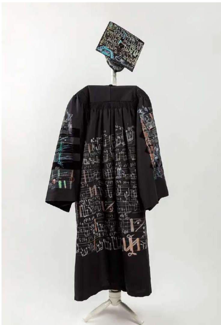
Brasília - Hermeto Pascoal apresenta obra que une música e artes visuais em SP - Arte Everton Ballardin/Divulgação