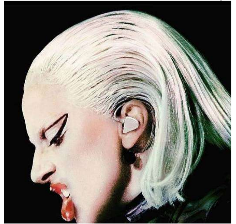
Lady Gaga posa para cartaz de obra que retrata turnê pós-pandemia