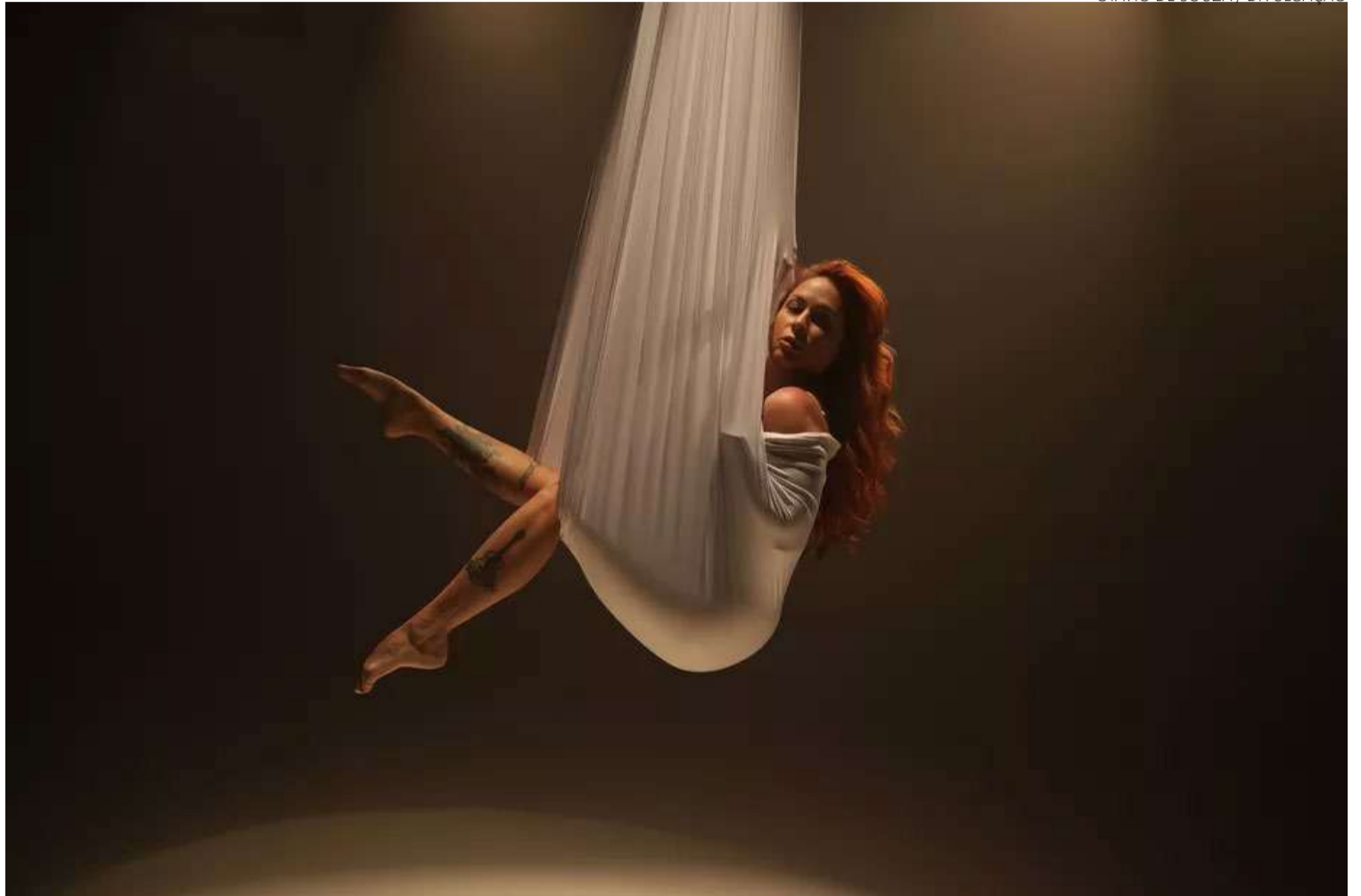
Pitty se apresenta em Pirenópolis durante festival de cerveja, no sábado, 1º

Foi delegado a Gal, inclusive, o primado de lançar uma música composta por Marina.