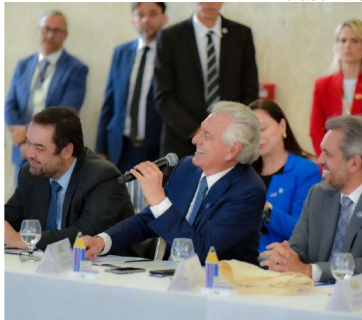
Ronaldo Caiado comenta dados do primeiro resultado do Compromisso Nacional Criança Alfabetizada

O ministro da Educação, Camilo Santana, destacou a conquista da educação brasileira no período pós-pandemia. “Retornamos ao patamar de 2019, um avanço muito importante”, frisou. Naquele ano citado por ele, a média de alfabetização estava em 55%. Em 2021, em meio à pandemia de Covid-19, caiu para 36%. Já em 2023, foi