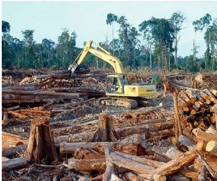
Cerrado concentra mais da metade de área desmatada no Brasil

Na região amazônica, o desmatamento caiu 62,2%, totalizando 454,3 mil hectares em 2023. Com exceção do Amapá, que registrou um aumento de 27%, todos os estados da re-